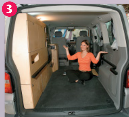
3 Multi-Talent: In weniger als drei Minuten ist der Space Camper ohne großen Kraftaufwand leer geräumt. Dann passen massenhaft Kisten und anderes Sperrgut hinein.