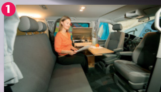
1 Alles easy: Die federleichte Sitzbank lässt sich mühelos ausbauen und wegtransportieren. Sie kann jedoch auch zusammengeklappt im Auto verbleiben.