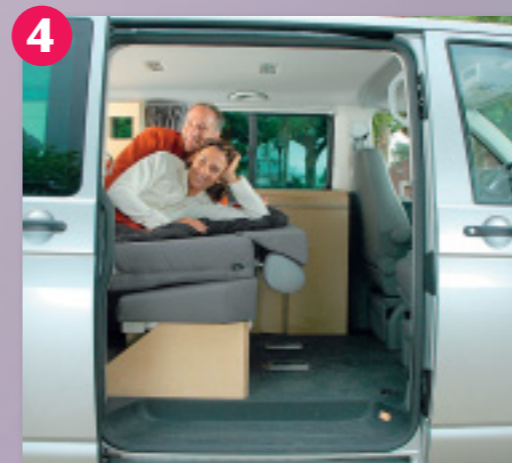
4 Schlaf-Platz: Mit einer Verlängerung misst das Doppelbett exakt zwei Meter. Die hochwertige Matratze garantiert angenehme Nachtruhe.